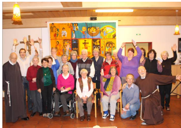
Teilnehmer Religiöse Woche in Altötting

Alle, die gemeinsam mit behinderten und kranken Menschen gute Ideen in gute Taten umsetzen wollen.